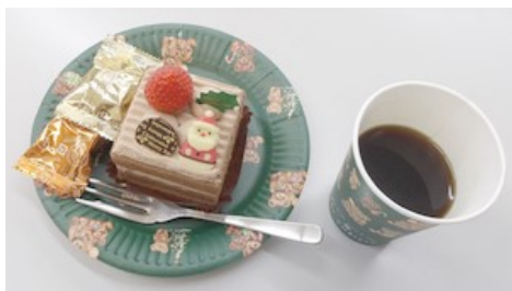
サンタさん付きおやつケーキ