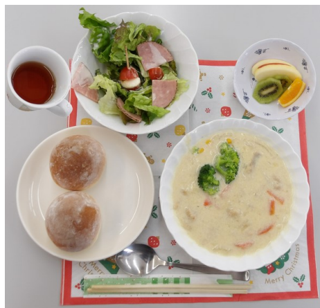
2024/12/24 クリスマス会のランチ